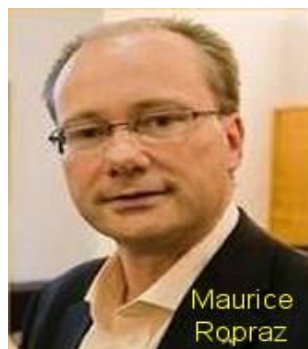
Les deux nouveaux conseillers d'Etat