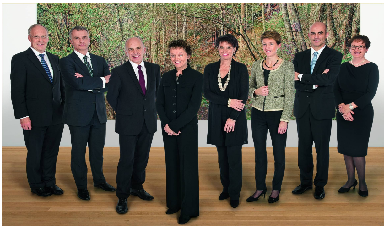
La chancelière de la Confédération